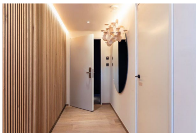
Porte RWD Schlatter à l'Europapark de Rust