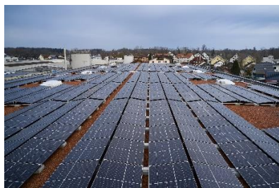
Dach mit Photovoltaik-Modulen